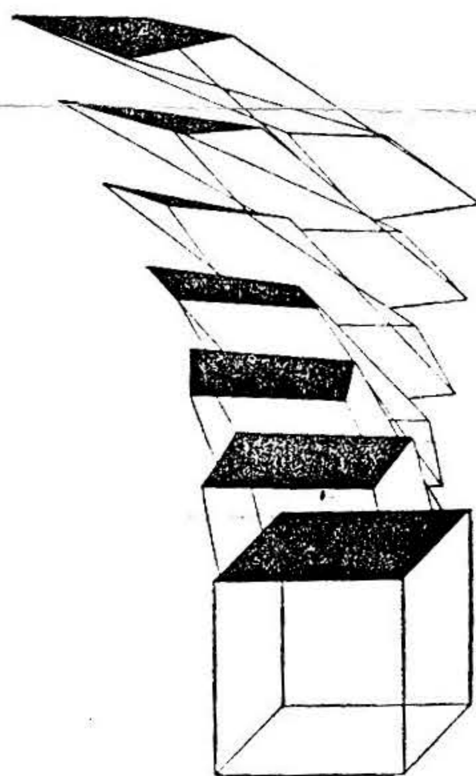
Kresby P. Rudolj

A tak si v takový večer s mužem, který strávil sobotu na kole, s jeho ženou a třeba ještě s jinými